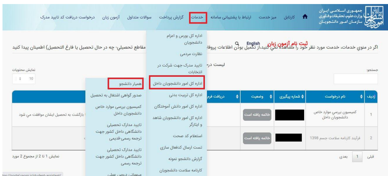
تصویر ۱ - انتخاب فرایند همیار دانشجو در پورتال

از جمله فرآیندهای اداره دانشجویان داخل، ثبت درخواست همیار دانشجو است. متقاضی قبلا در پورتال سامانه جامع امور دانشجویان (سجاد) ثبت نام کرده و نام کاربری و رمز عبور دریافت نموده است و پس از ورود به پورتال درخواست فوق را از سربرگ خدمات، بخش امور دانشجویان داخل، گزینه همیار دانشجو را انتخاب و اقدام به ثبت درخواست می کند (چنانچه دانشگاه مورد نظر در لیست دانشگاه های تعریف شده در سامانه نباشد پیغام اخطار تصویر ۳ نمایش داده می شود). پس از ثبت درخواست و دریافت کد پیگیری توسط متقاضیانی که امکان مشاهده و ثبت این درخواست را دارند، درخواست توسط کارشناس مسئول همیاران دانشجو هر دانشگاه، بررسی می شود و در صورت تایید یا عدم تایید درخواست ها، وضعیت فرایند در پورتال به "خاتمه یافته" تغییر پیدا خواهد کرد و متن مناسب در بخش توضیحات به متقاضی نمایش داده خواهد شد. (تصاویر ۱ و ۲)