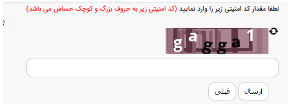
تصویر ۵- ثبت و ارسال اطلاعات

پس از تکمیل اطلاعات و پاسخ به سوال امنیتی بر روی دکمه "ثبت و ارسال و دریافت کد پیگیری" کلیک کنید. (تصویر ۴)